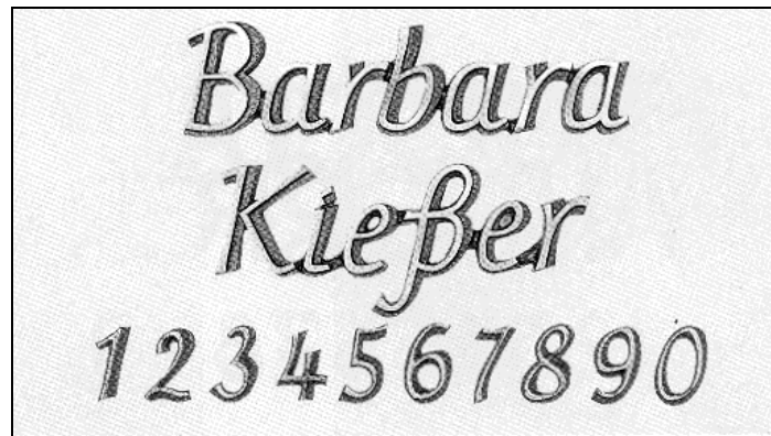
Cursum zusammenhängend (Strassacker)